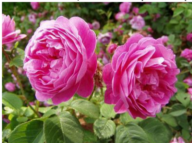
ruža Erinnerung an Brod

Pokračuje zverejnenie výziev – stručne veľké písmená – súťaž o televízor ( písmená ako nadpis aby udrľ do očí ). Janka to potom prepošle na ďalšie webovské stránky v obciach.